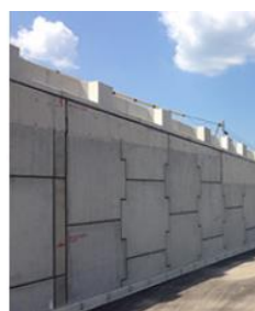
優れた耐久性で軽量 帯状ジオンテックス補強土壁