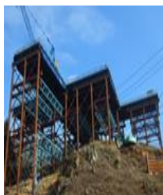
敏速施工で工期短縮 ヒロセ仮橋工法シリーズ