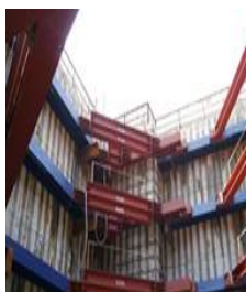
広い作業空間を実現 ヒロセメガビーム®